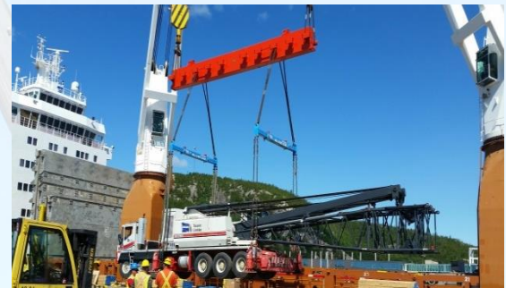
Chargement grue 300 T Link-Belt sur camion au Port de Baie-Comeau

Le site est situé au Canada, à 520 km au nord du cercle polaire Arctique sur l'île de Baffin. Le projet comprend également la construction d'un chemin de fer de 145 km entre la mine et le port pour l'expédition de minerai de fer.